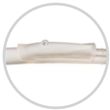
Passiver Behälter BF00.D51