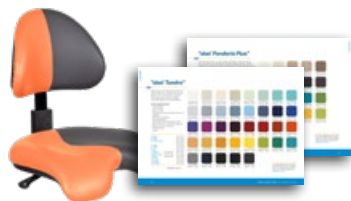
„skai Tundra“ Seite 102

Standardfarbe Anthrazit Art. Nr.: 3037 0052