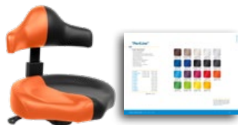
„PeriLine“ Seite 105

Standardfarbe Schwarz Art. Nr.: 3037 0235