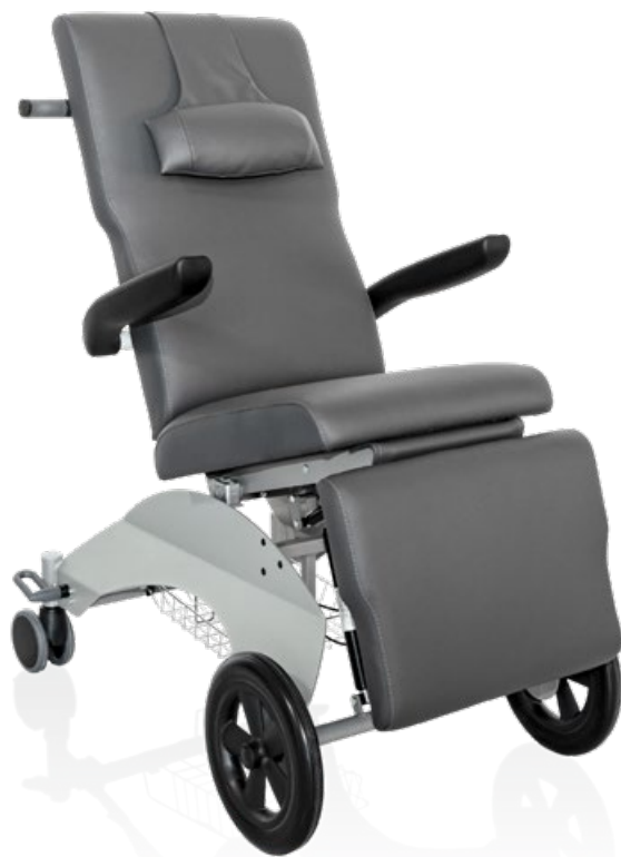
motionLine Art. Nr.: 1700 0000