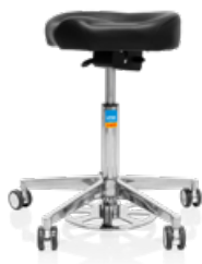
easyPro F Art. Nr.: 2400 0010