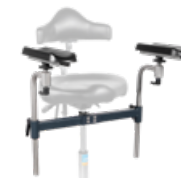
assistPro F Armlehnsatz inkl. Aufnahmetraverse,