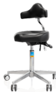
assistPro H Art. Nr.: 2400 0009