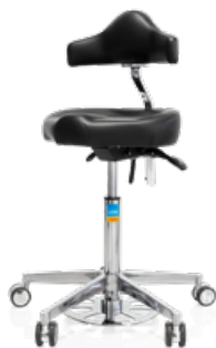
assistPro F Art. Nr.: 2400 0005