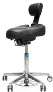
assistTrend Art. Nr.: 2500 0002