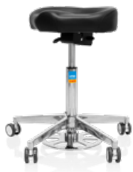
easyPro F Art. Nr.: 2400 0010