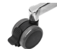
Doppelrolle 65 mm, bremsbar