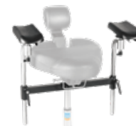
assistTrend Armlehnsatz inkl. Aufnahmetraverse,