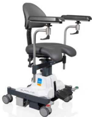
surgiLine Formsitz Art. Nr.: 2200 0008