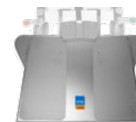
surgiLine Fußschalterplatte 480x715 mm, Höhe 53 mm