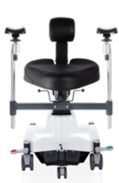
surgiTrend Dynamic Sitz Art. Nr.: 2200 0010