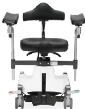
surgiLine Comfort Sitz Art. Nr.: 2200 0013