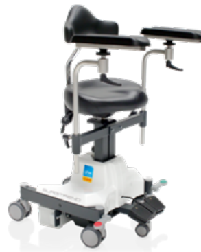
surgiTrend Comfort Sitz Art. Nr.: 2200 0012