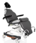
500 XLE comfort