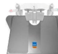
surgiTrend Fußschalterplatte 480x715 mm, Höhe 53 mm