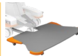
Fußschalterplatte 429x820 mm, Höhe 53 mm