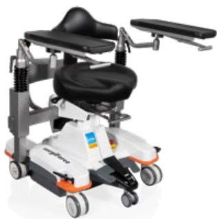
surgiForce Comfort Sitz Art. Nr.: 2600 0004