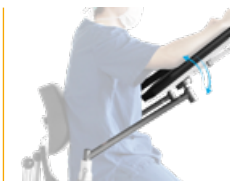
Armlehnenatz mit Einhandauslöser für Neurochirurgie (schräg), Nachrüstatz