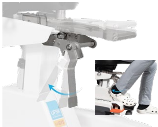
Fußauslösung für Schiebeschlitten, zur sterilen Verstellung des Schiebeschlittens