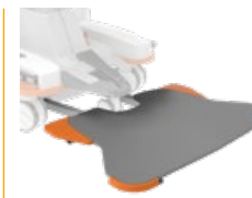
Fußschalterplatte 429x690 mm, Höhe 53 mm