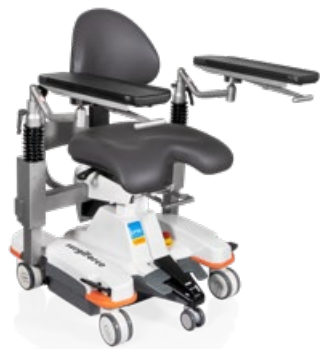
surgiForce Formsitz Art. Nr.: 2600 0008