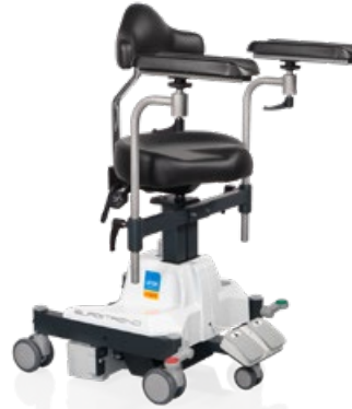
surgiTrend Comfort Sitz Art. Nr.: 2200 0012