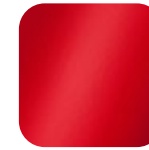
rot 010878 Art. Nr.: .....238