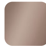
light brown 016037 Art. Nr.: .....239