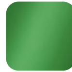
kiwi 015816 Art. Nr.: .....233