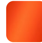
orange 016040 Art. Nr.: .....237