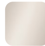
creme 015812 Art. Nr.: .....225