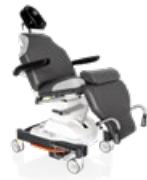
500 XLE comfort