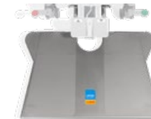
surgiTrend Fußschalterplatte 480x715 mm, Höhe 53 mm