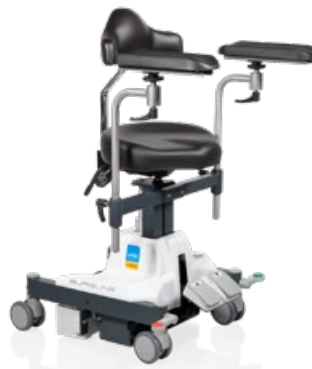
surgiLine Comfort Sitz Art. Nr.: 2200 0013