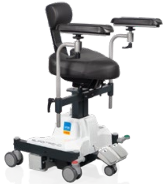
surgiTrend Dynamic Sitz Art. Nr.: 2200 0010