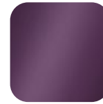
aubergine 016041 Art. Nr.: .....229