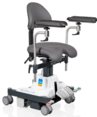
surgiLine Formsitz Art. Nr.: 2200 0008