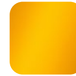
safran 010879 Art. Nr.: .....227

Die angezeigten Farben auf Ihrem Gerät können geringfügig von den Originalfarben abweichen. Originalfarbkarten können Sie unter info@ufsk-osys.com anfordern.