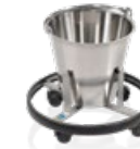
stayClean kick bucket