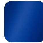
delft 010766 Art. Nr.: .....241