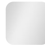
weiß 010881 Art. Nr.: .....224