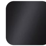
schwarz 011499 Art. Nr.: .....235