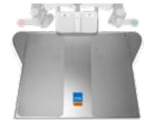
surgiLine Fußschalterplatte 480x715 mm, Höhe 53 mm