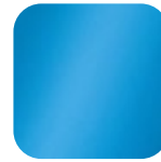
azur 015815 Art. Nr.: .....230