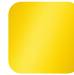
lemon 016039 Art. Nr.: .....226