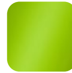
lime green 016043 Art. Nr.: .....232