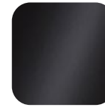
antistatisch schwarz Art. Nr.: .....223