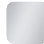
stein 015813 Art. Nr.: .....236