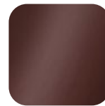
kastanie 015817 Art. Nr.: .....240