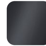
anthracit 016046 Art. Nr.: .....234