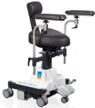
surgiTrend Dynamic Sitz Art. Nr.: 2200 0010