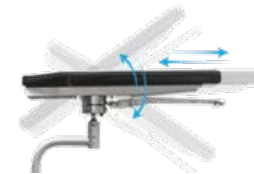
Armlehnsatz mit Linearführung und Einhandauslöser, Verfahrweg 110 mm, ab-Werk-Montage