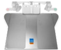
surgiLine Fußschalterplatte 480x715 mm, Höhe 53 mm